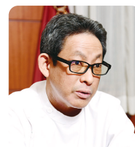
監修：渡邊 雄介先生